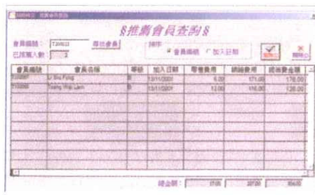
層壓式招收會員並無犯法。