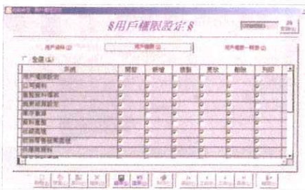
可設定員工權限，防止員工破壞系統。

Ctrl+Alt+del或是Reboot都沒有用，Boot完還是會繼續播廣告，這樣除了防止有人「打免費機」外，還可增加收入來源，一舉兩得。別以為認識網吧員工便可「打免費機」，系統有Option去更改員工的權限，員工不可隨意修改登入系統時間，更勿論去Hack那登入用的Smart Card機了。每次玩者登入／登出都有紀錄，收費紀錄無所遁形，每月結算又方便，會員分等級、假日不同時段收費等通通有齊，一間軟件公司加一間網絡公司便可開一間網吧（當然各位如有份量可選擇自建一切）。